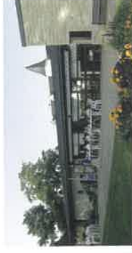
Relais Sépia de Descartes