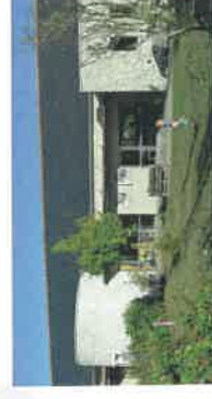
Relais Sépia du Lathan